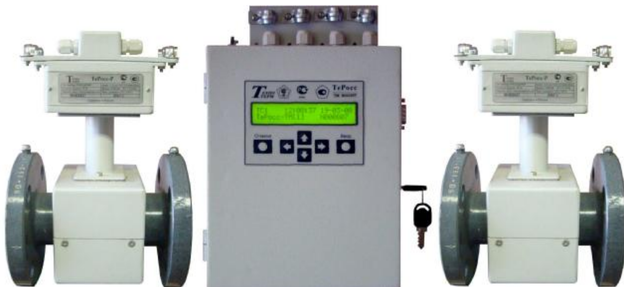
Рисунок 1 – Общий вид теплосчетчика TeRoss-ТМ с TeRoss-ВУ и TeRoss-ИБ в составе с ПРЭ