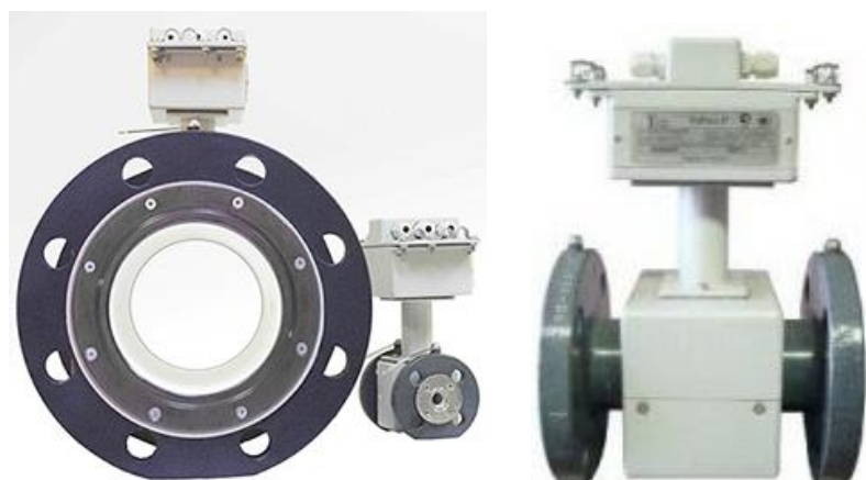
Рисунок 4.2 – Общий вид ПРЭ