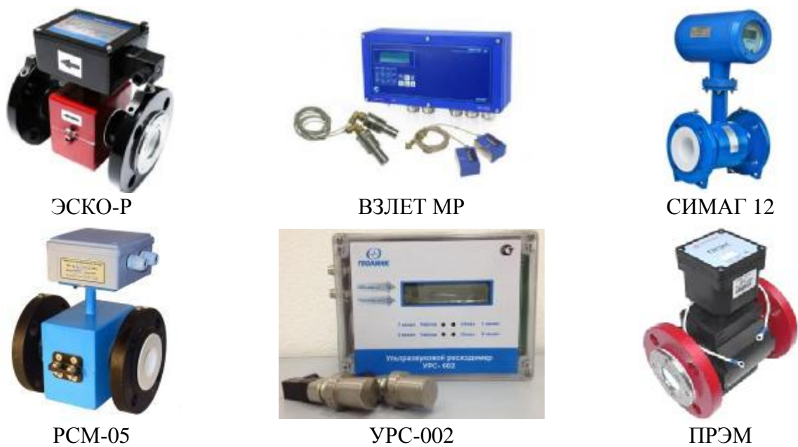
Рисунок 4.1 – Общий вид ПРИ