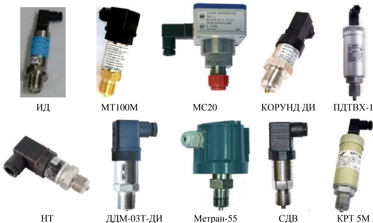
Рисунок 5 – Общий вид ПД