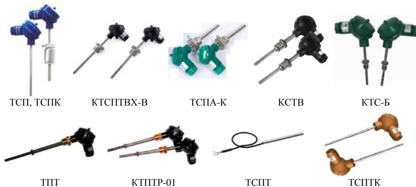
Рисунок 3.2 – Общий вид ПТ