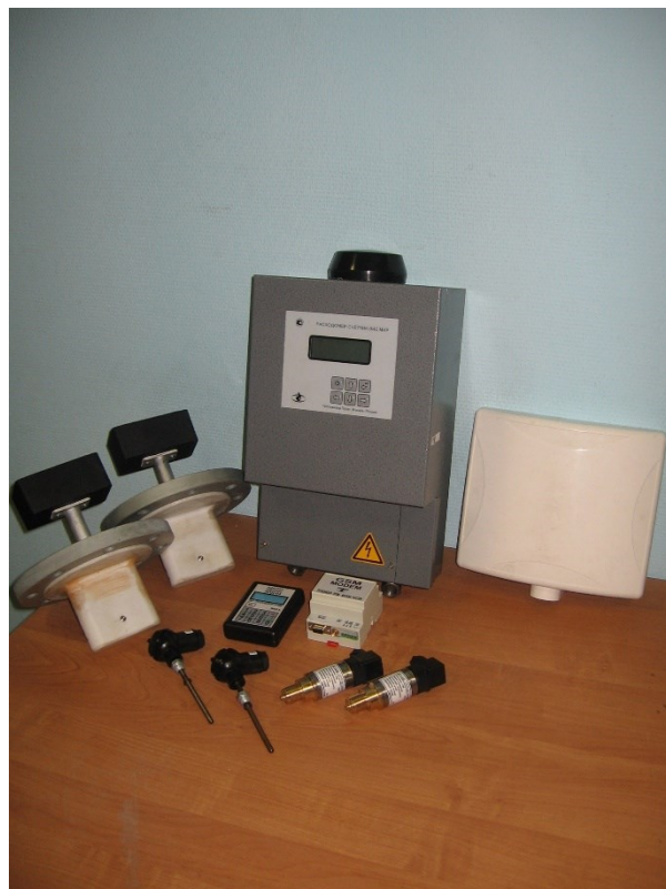
Внешний вид теплосчетчика с электромагнитными преобразователями скорости погружного типа