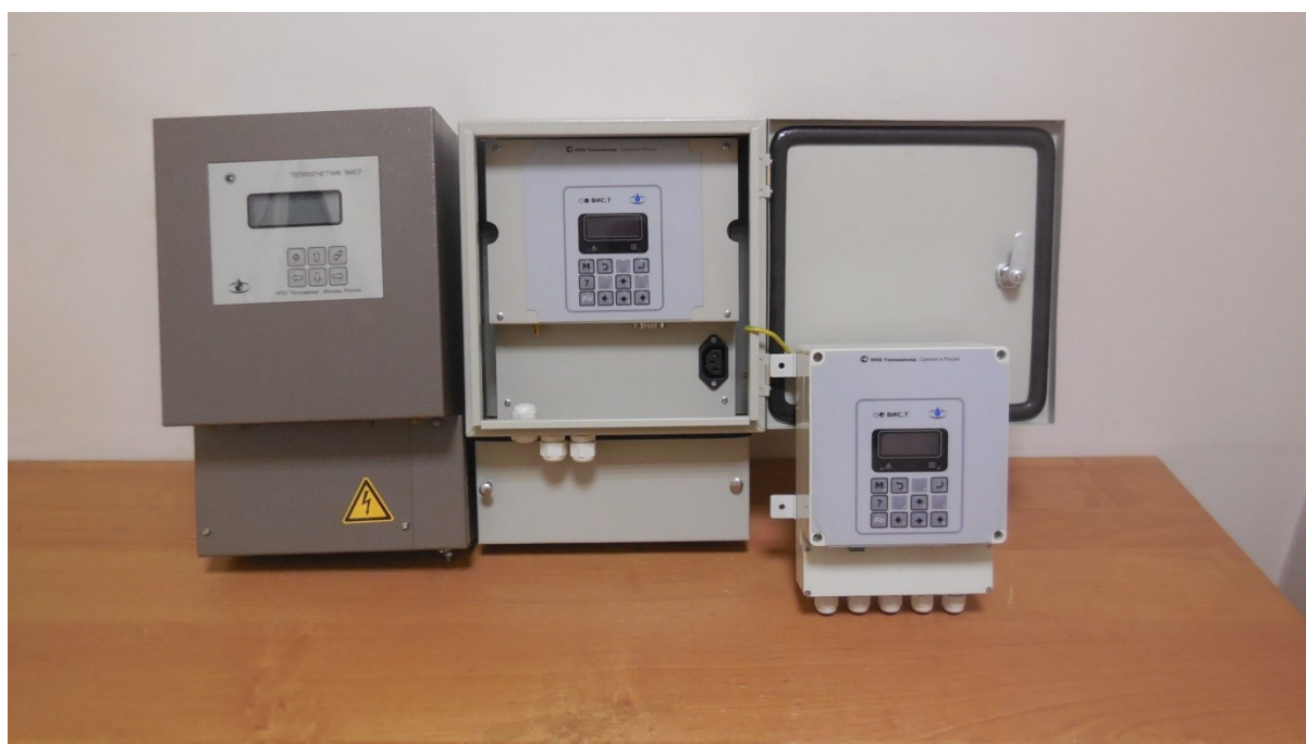
Внешний вид электронных блоков Рисунок 1 - Общий вид средства измерений