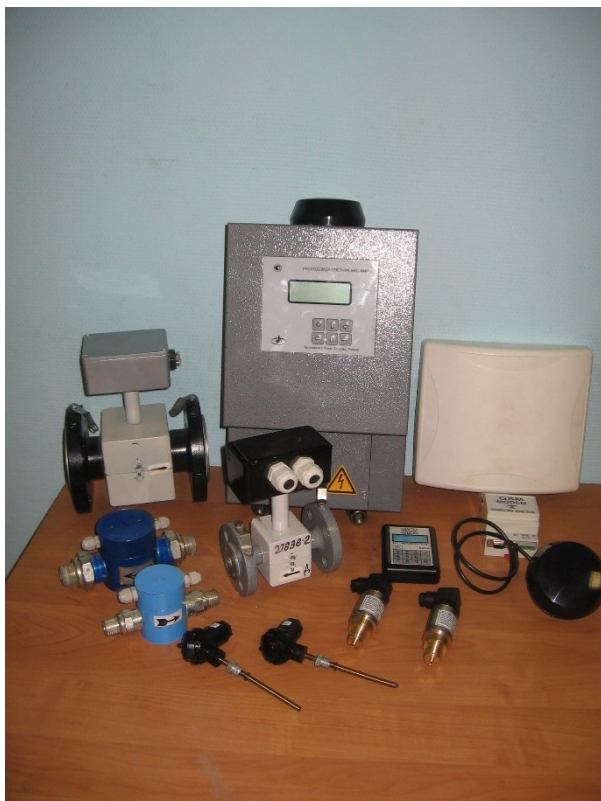
Внешний вид теплосчетчика с электромагнитными преобразователями расхода полнопроходного типа

Общий вид средства измерений представлен на рисунке 1. Схемы пломбирования от несанкционированного доступа с обозначением мест нанесения знака поверки и паспортных табличек (этикеток) с идентифицирующими изделия обозначениями, расположенных на боковой поверхности корпуса электронного блока и клеммной коробки первичного преобразователя, представлены на рисунках 2 и 3.